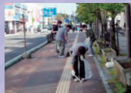
クリーンボランティア