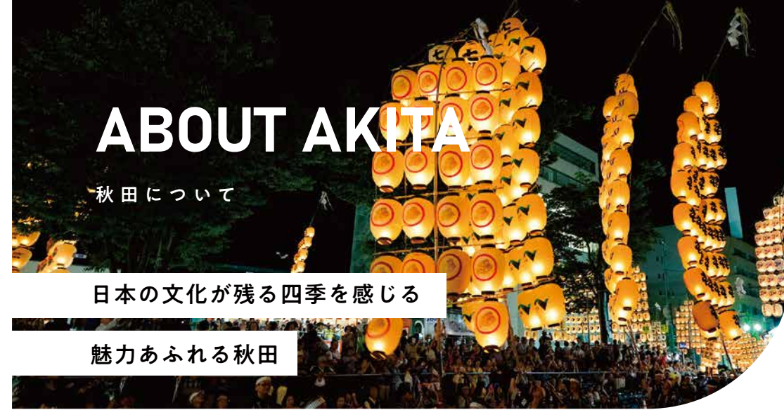
竿燈まつり Kanto Festival

A: 生活のことは生活相談スタッフ、勉強のことは教員にいつでも相談できます。また、3ヶ月に1回、個人面談を行っています。 You can always consult with the life counseling staff about life and the faculty about studying. In addition, we hold personal interviews once every three months.